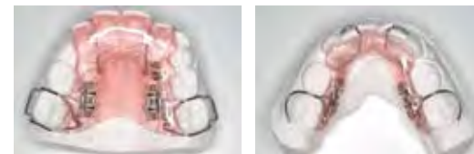
顎を広げることにより矯正治療を行う床矯正の治療装置

矯正治療は歯を抜いて行うものと思っていませんか？従来の矯正治療では歯を抜いた後に矯正を始めるケースが一般的でした。でこぼこの歯並びを整える（矯正をする）には、歯を適切な場所に動かしてあげるスペースを確保する必要があります。このような形の矯正では、上下左右で4本抜歯します。しかし、顎を広げる床矯正では、歯を抜かないで矯正治療を行なうことが出来ます。