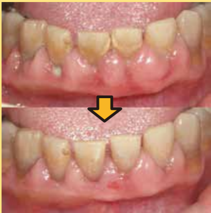
初診時 歯肉が腫れているのがわかります。

「虫歯もないし、とても調子の良い」お口の中でも、無症状のうちに進行するという特性から、歯周病が見逃されている場合もあります。