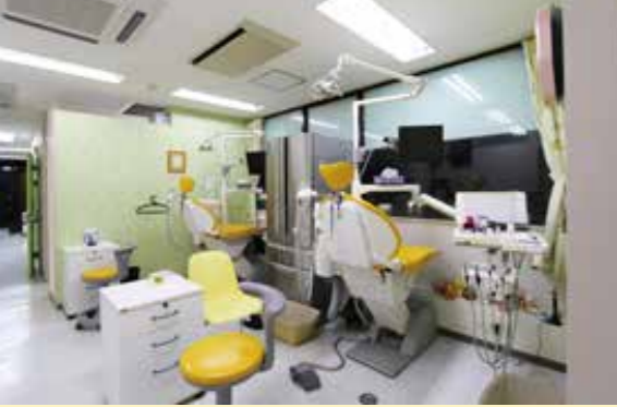
小児専用診療室：保護者の方も治療に同席できます。

乳歯はいずれ抜け、永久歯がはえてきますが、乳歯の虫歯をそのままにしておくと永久歯の強さや永久歯の生え方にも影響が出てくることがあります。