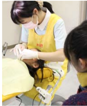
小児の治療中は保護者の方に同席していただくことが可能です。

歯を抜かないと、きれいな歯並びにならないの？ そんな疑問をお持ちの方も少なくないと思います。 従来は、歯を抜いた後に矯正を始めることが多かったのです。それでは何故、歯を抜くのでしょうか？ それは、でこぼこの歯並びを整えるには、歯列矯正で歯を適切な場所に動かしてあげるスペースを確保する必要があるからです。しかし、歯を動かすスペースがあれば、健康な歯を抜かなくても良い訳です。 歯を抜く必要があるかどうかは、不正咬合の状態とアゴの骨や歯の大きさによって判断することができます。当院では、なるべく患者の皆さまのお体に負担をかけないように、